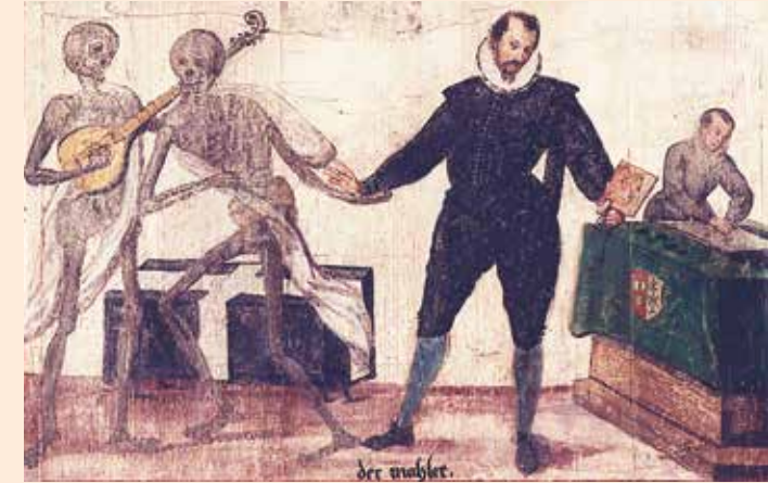
Der Tod und der Maler - Detail aus dem Füssener Totentanz

Unter dem Motto „Sagt Ja Sagt Nein, Getanzt Muess sein“ folgen im Füssener Totentanz zwanzig Stände,