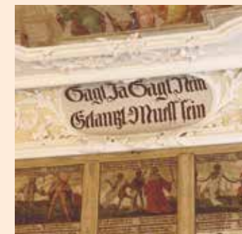
Füssener Totentanz in der Annakapelle