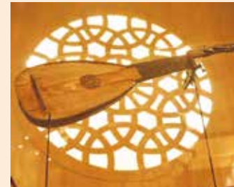
Laute von Wolfgang Wolf, 16. Jh.

Doch viele Füssener Instrumentenmacher wanderten aus und gründeten in den europäischen Kulturmetropolen bedeutende Werkstätten. So waren in Venedig und Padua im 16. und 17. Jahrhundert etwa zwei Drittel aller Lautenmacher Füssener Abstammung und dominierten dieses Handwerk fast monopolartig.