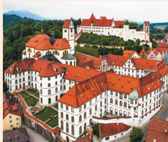
Ehemaliges Benediktinerkloster St. Mang und Hohes Schloss

© Herausgeber und PrePress: Museum der Stadt Füssen, Juli 2022 Basislayout: JUNG GmbH, München Titelmotiv: Tod und Fürstin, Detail aus dem Füssener Totentanz, 1602 Druck: Saxoprint, Dresden Irrtum und Änderungen vorbehalten