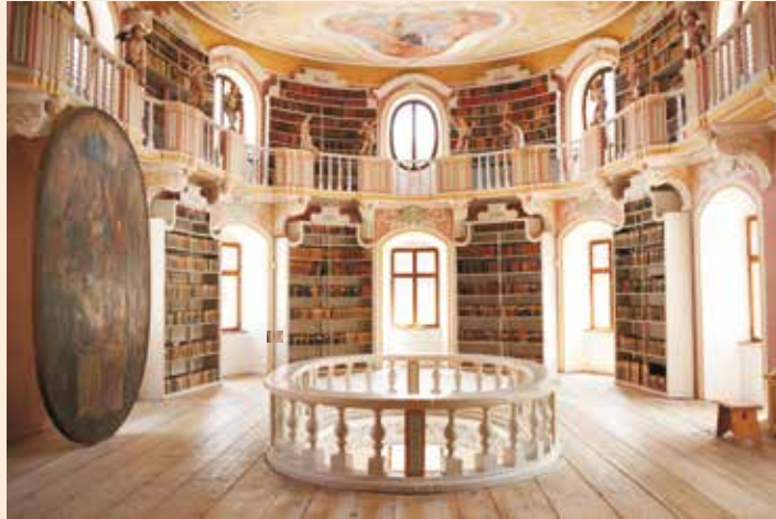
Blick in die Klosterbibliothek St. Mang

Die herrlichen barocken Repräsentationsräume des ehemaligen Benediktinerklosters St. Mang stehen Ihnen zur Besichtigung offen.