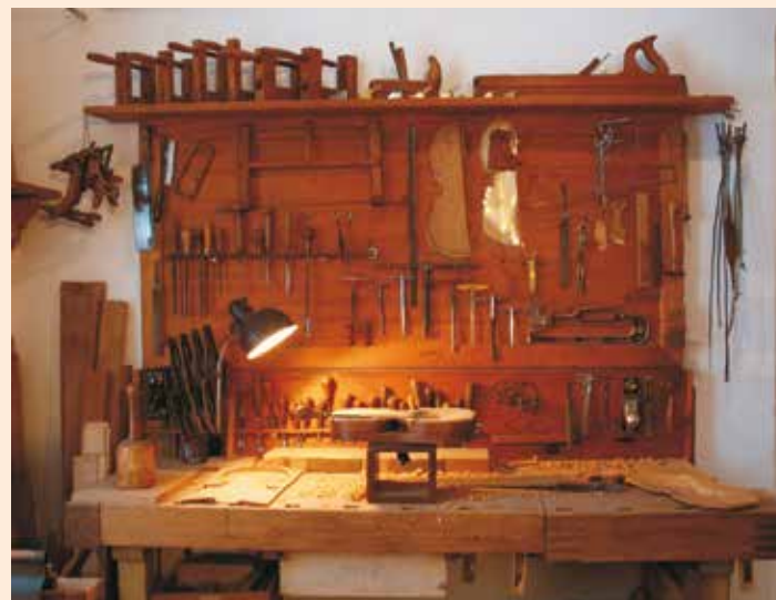
Geigenmacherwerkstatt von Konrad Leonhardt