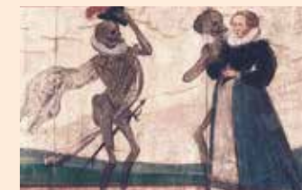
Der Tod und die Jungfrau - Detail aus dem Füssener Totentanz

Unter dem Motto „Sagt Ja Sagt Nein, Getanzt Muess sein“ folgen im Füssener Totentanz zwanzig Stände,