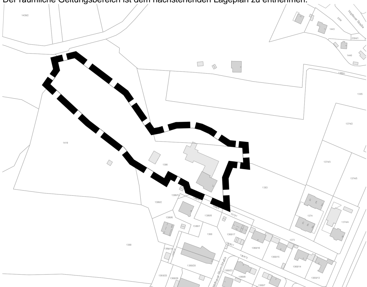
Lageplan mit Geltungsbereich, ohne Maßstab

Der räumliche Geltungsbereich ist dem nachstehenden Lageplan zu entnehmen: