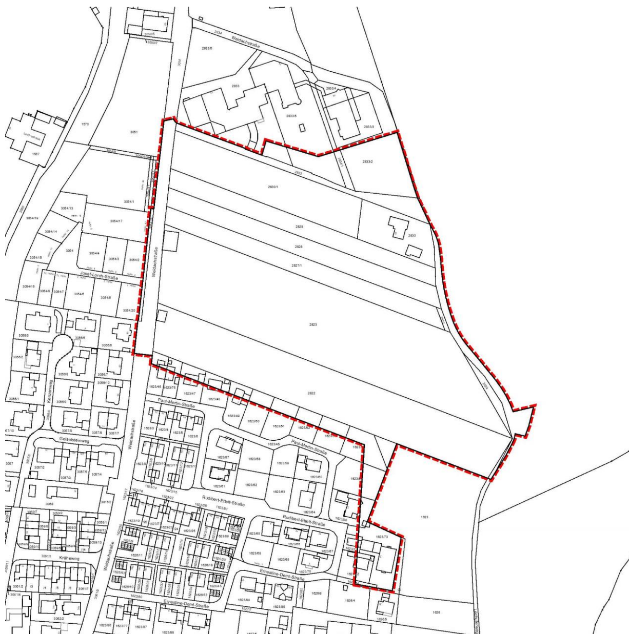
Übersichtslageplan mit Geltungsbereich der 43. Flächennutzungsplanänderung, ohne Maßstab

Der räumliche Geltungsbereich der 43. Änderung des Flächennutzungsplans ist dem nachstehenden Übersichtslageplan zu entnehmen.