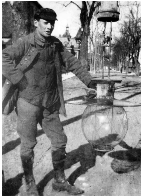
Ein Arbeiter mit einer Straßenlaterne in der Augsburger Straße, um 1910; StdAF, BD 2025.